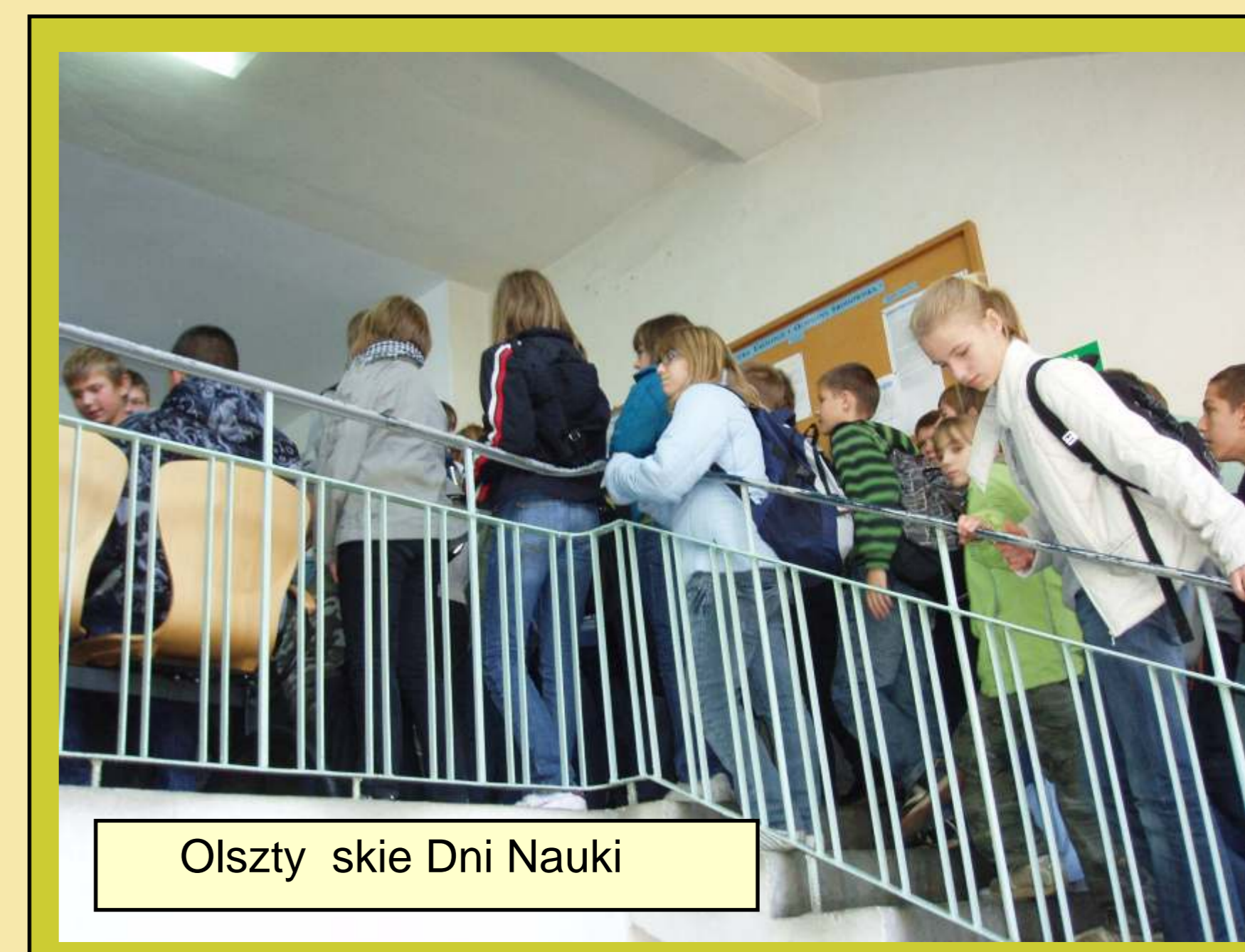
Olsztynskie Dni Nauki

Trzeba podjąć w dydaktyce akademickiej działalność korespondującą z edukacją pozaszkolną. Miejsce edukacji może być w każdym „tu i teraz”, a nie tylko w czterech ścianach uniwersytetu.