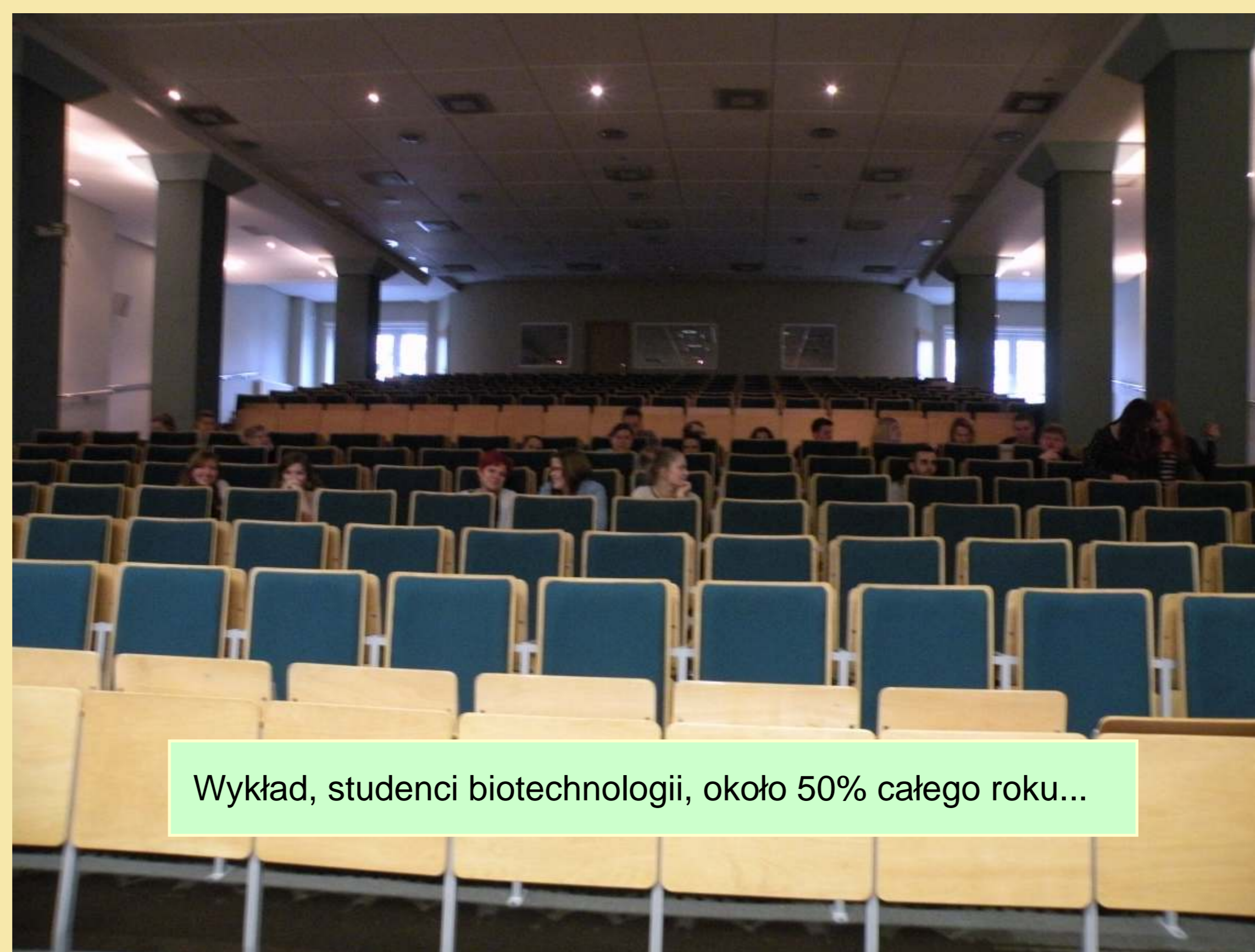
Wykład, studenci biotechnologii, około 50% całego roku...

Forma dydaktyki akademickiej musi nadążać za kontekstem miejsca i słuchacza. Inaczej musimy motywować do wysiłku edukacyjnego przez całe życie.