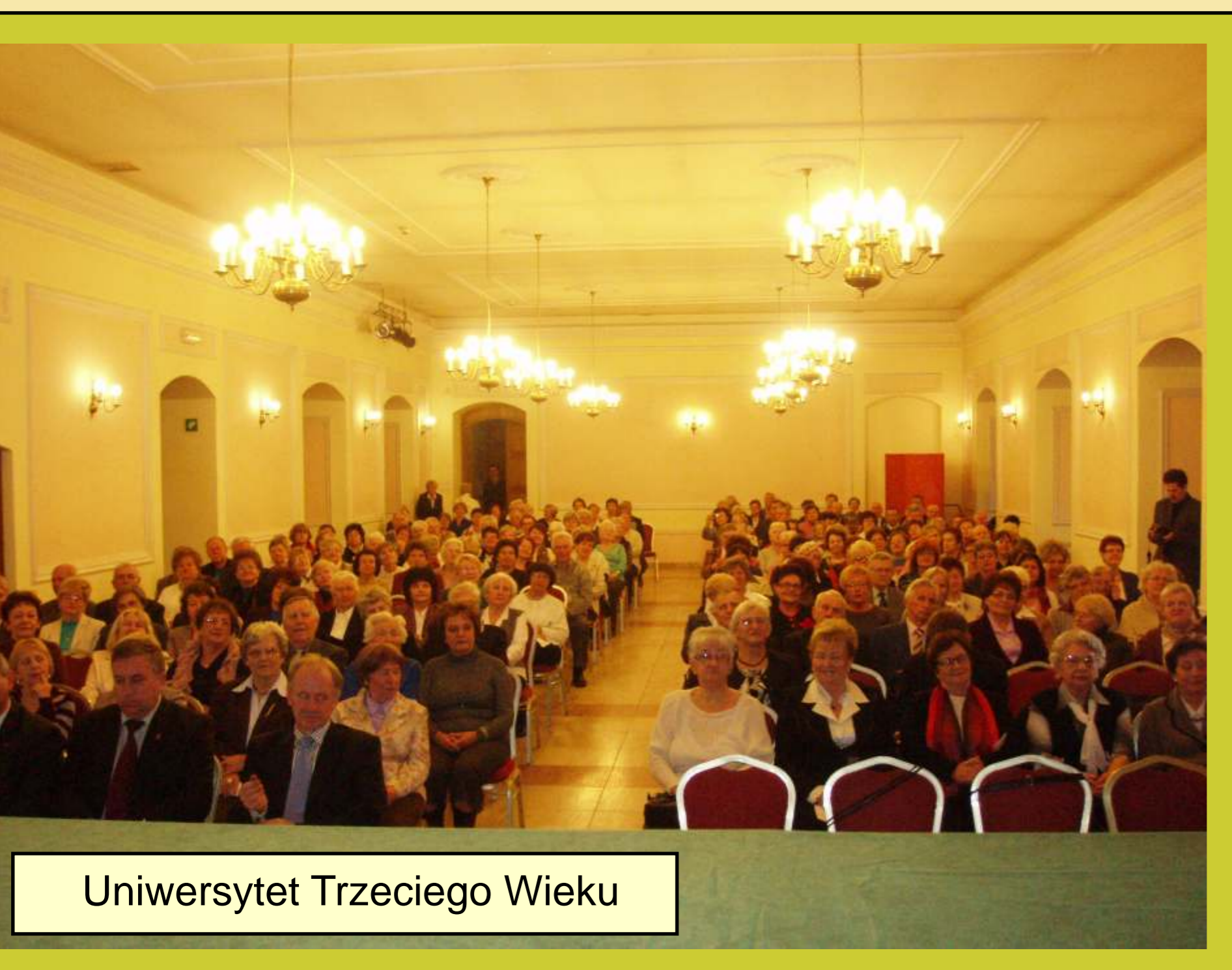
Uniwersytet Trzeciego Wieku